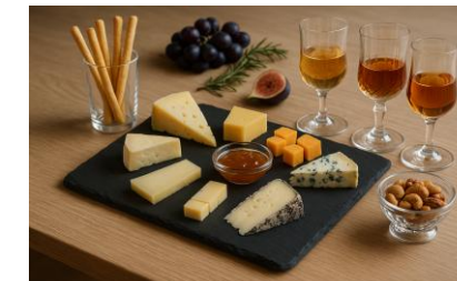
Сыр и Херес крепленный союз