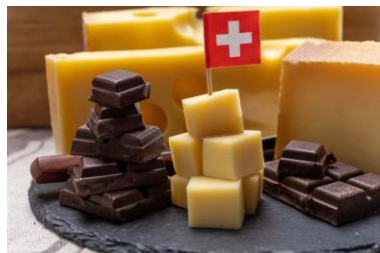
Путешествие по Швейцарии