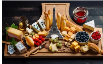
Идеальный французский стиль