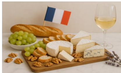
По французским рецептам