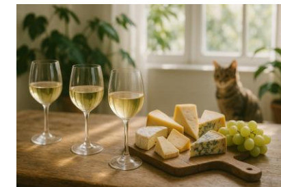
Влюбиться в Совиньон