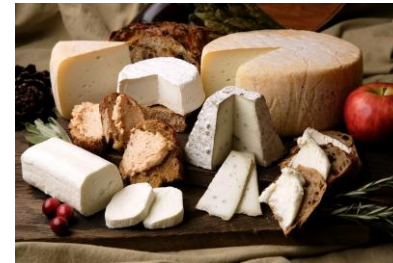
Козьи и овечьи сыры