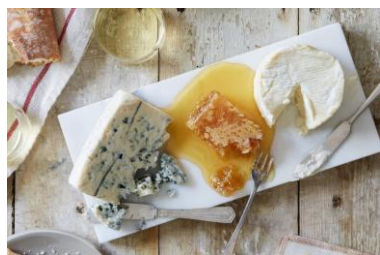
Сыры с плесенью