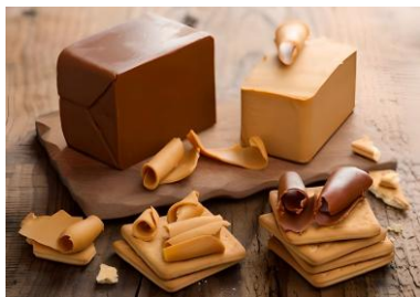
Редкие и необычные сыры

Больше концепций сырных вечеринок на сайте: chesom.net